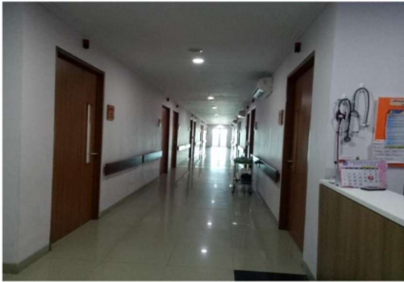
Gambar 1. Koridor Ruang Rawat Inap Yang Telah Dilakukan Pembersihan (Rahayu et al., 2019)