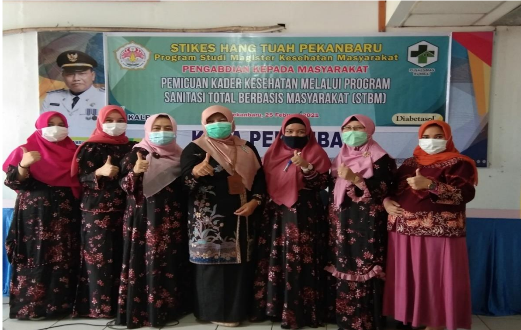
Gambar 1. Foto bersama tim pengabdian dan kepala puskesmas Rumbai