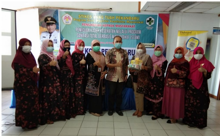
Gambar 1. Foto bersama Sekretaris Camat dan Kepala Puskesmas Rumbai

Kegiatan pengabdian kepada masyarakat dengan judul penyuluhan cuci tangan pakai sabun kepada kader atau fasilitator kesehatan sebagai salah satu pencegahan COVID-19 di Puskesmas Rumbai yang dilaksanakan di Aula Kantor Camat Rumbai Kota Pekanbaru oleh tim pengabdian masyarakat Prodi S2 Kesehatan Masyarakat STIKes Hang Tuah Pekanbaru yang berjumlah 4 (empat) orang dosen tetap dan 2 (dua) orang mahasiswa. Kegiatan ini diadakan pada hari Kamis, 25 Februari 2021 yang dihadiri oleh Camat Rumbai yang diwakili oleh Sekretaris Camat, Kepala Puskesmas Rumbai dan jajaran beserta kader kesehatan yang berjumlah 35 orang. Kegiatan dibuka dengan kata sambutan oleh Ibu Sekretaris Camat Rumbai dilanjutkan Kepala Puskesmas Rumbai dan Kepala Program Studi S2 Kesmas STIKes Hang Tuah Pekanbaru. Setelah itu dilanjutkan dengan pemberian cenderamata kepada Ibu Sekretaris Camat yang disponsori oleh Diabetasol.