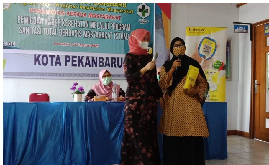
Gambar 3. Pemberian reward kepada kader kesehatan

untuk menjawab pertanyaan yang telah diberikan pada lembar pre test. Setelah dilakukan pengisian kuesioner pre test maka kegiatan selanjutnya dengan melakukan penyuluhan terkait cuci tangan pakai sabun dan FGD serta terakhir dilakukan pengisian lembar post test kembali kepada kader kesehatan. Diakhir sesi juga dilakukan feedback tanya jawab kepada ibu-ibu kader kesehatan dan setiap kader kesehatan yang bisa menjawab dengan benar maka diberikan reward sebagai reinforcement positif bagi kader kesehatan dan kader terlihat senang dan antusias saat mengikuti kegiatan penyuluhan ini.