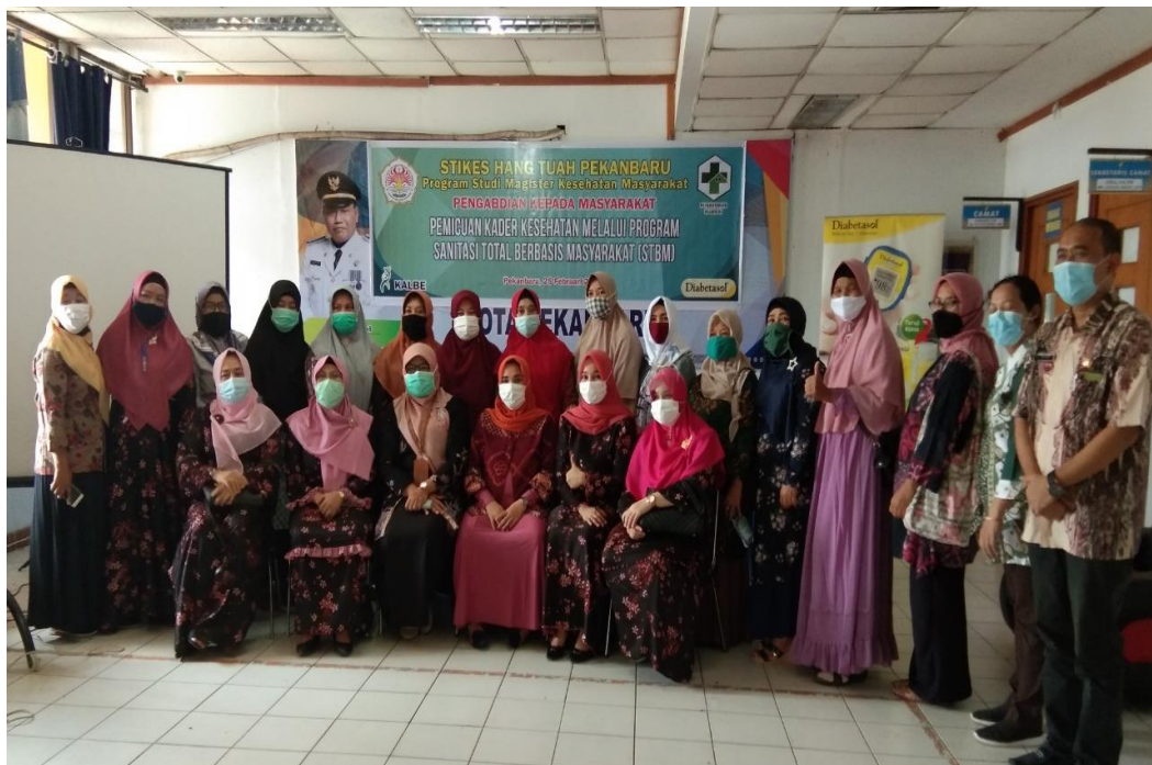
Gambar 2. Foto bersama tim pengabdian, perwakilan Puskesmas Rumbai dan kader kesehatan