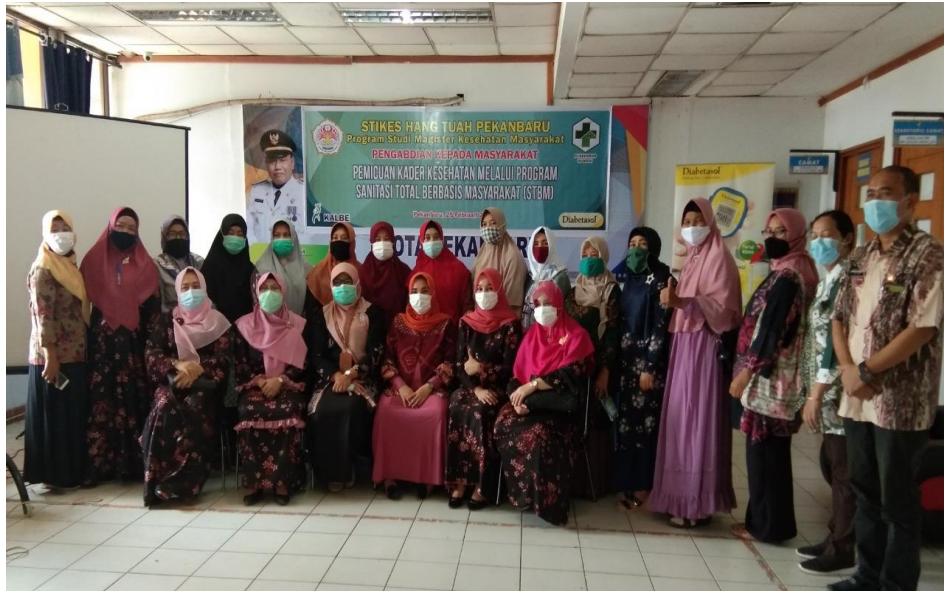
Gambar 4. Foto bersama Kepala Puskesmas Rumbai dan perwakilan kader kesehatan

Adapun data karakteristik dari kader kesehatan yang mengikuti pengabdian masyarakat sebagai berikut: