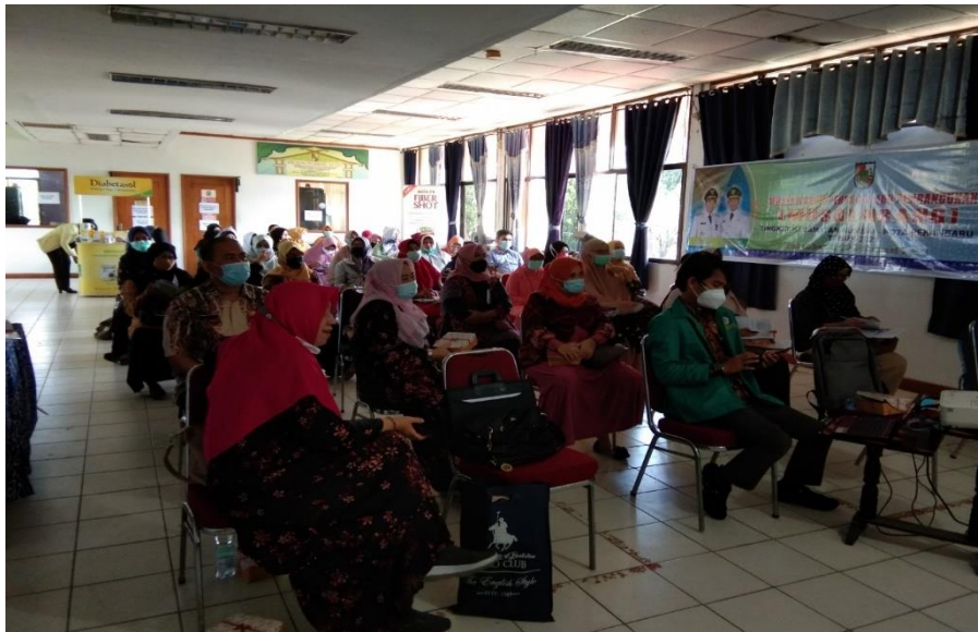
Gambar 2. Foto saat penyuluhan berlangsung di Aula Kantor Camat Rumbai

Kegiatan pengabdian ini merupakan kegiatan rutin yang dilakukan oleh Prodi S2 Kesmas STIKes Hang Tuah sebagai bentuk pengabdian kepada masyarakat sesuai dengan tema yang diambil pada saat kegiatan ini berlangsung. Untuk kegiatan kali ini dengan tema Pemicuan Kader Kesehatan Melalui Program STBM. Dalam kegiatan ini sasarannya adalah kader kesehatan sebagai fasilitator bagi masyarakat untuk meningkatkan pengetahuan masyarakat terhadap penerapan cuci tangan pakai sabun sebagai salah satu pilar STBM dan sekaligus sebagai salah satu pencegahan COVID-19. Metode pelaksanaan kegiatan ini dilakukan dengan 2 (dua) tahapan yaitu pertama dengan melakukan penyuluhan pemicuan kader kesehatan terhadap cuci tangan pakai sabun dengan menggunakan power point dan kedua dengan melakukan FGD kepada kader kesehatan untuk membahas dan memberikan pengetahuan lanjutan kepada kader kesehatan terkait materi yang telah disampaikan dan permasalahan yang ditemukan oleh kader kesehatan terkait penerapan cuci tangan pakai sabun bagi masyarakat.