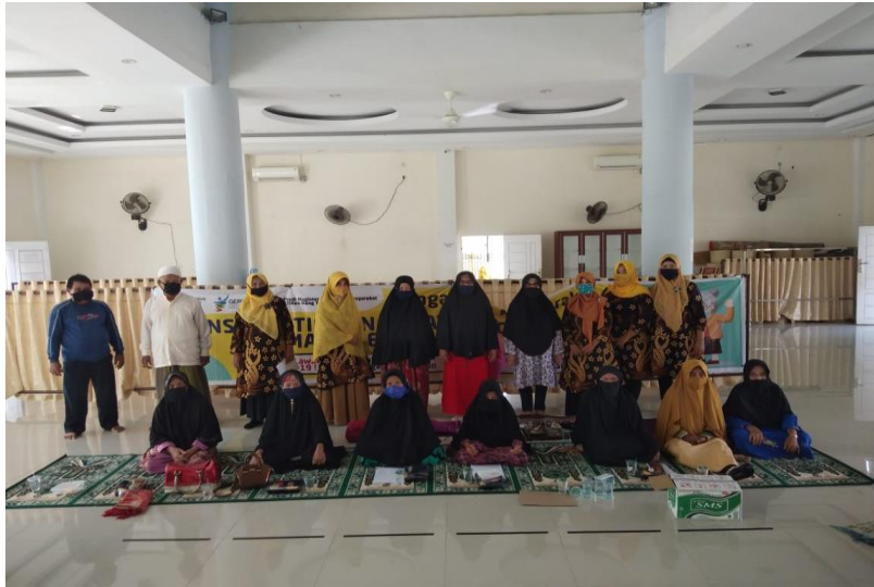
Lansia beserta kader posyandu lansia yang mengikuti penyuluhan