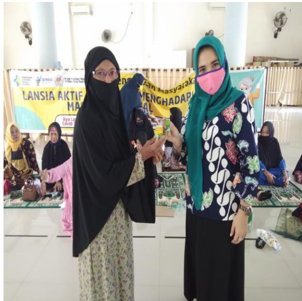
Saat memberikan materi penyuluhan dan pemberian gift kepada lansia