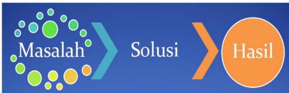
Gambar 1.2 : Elemen Terkait Dalam Sebuah Sistem Pendukung Keputusan

Secara konsep ada 3(tiga) elemen yang terkait dengan Sistem Pendukung Keputusan, berikut ini adalah gambar dari setiap elemen yang terkait dalam sistem pendukung keputusan yaitu: