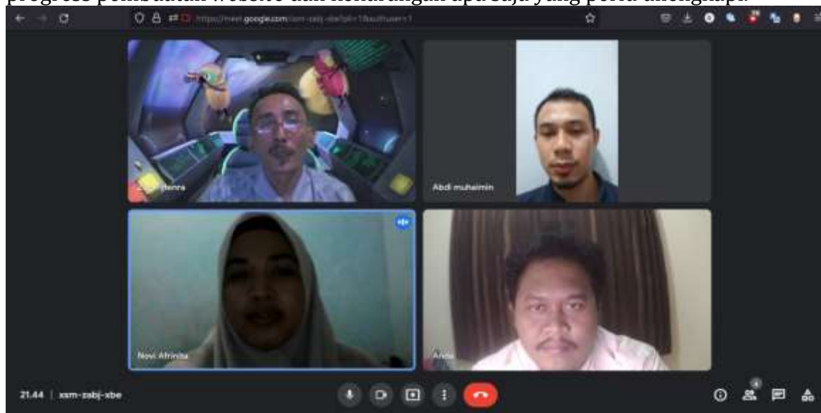
Gambar 4. Pertemuan secara daring