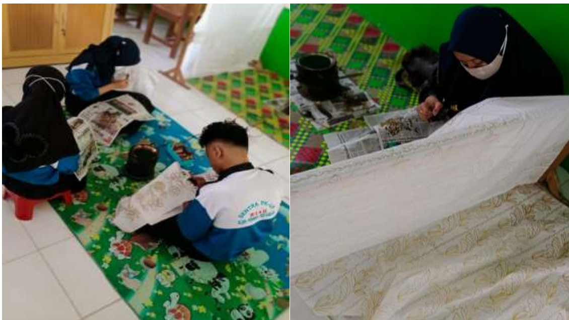
Gambar 1. Proses membuat motif batik