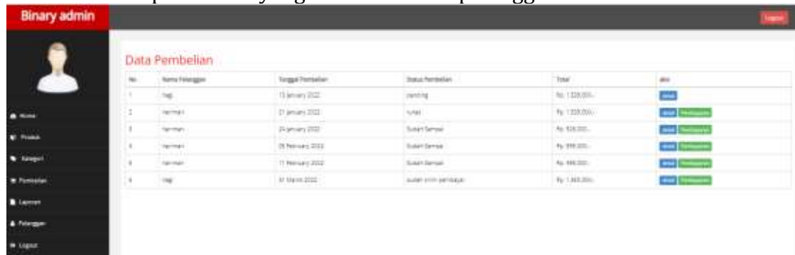
Gambar 12. Halaman Pembelian