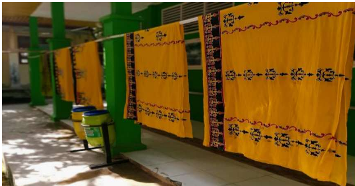
Gambar 3. Proses mengeringkan kain batik