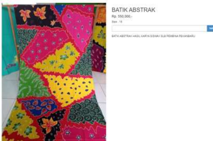
Gambar 15. Menu pembelian produk pelanggan