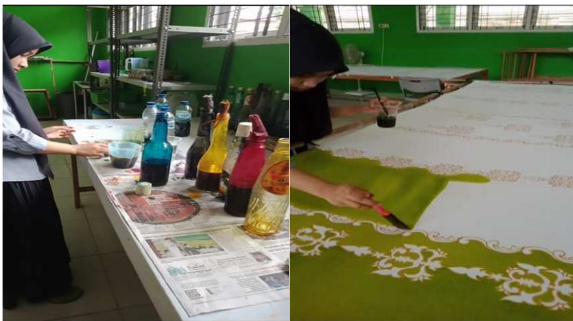
Gambar 2. Proses mewarnai kain batik