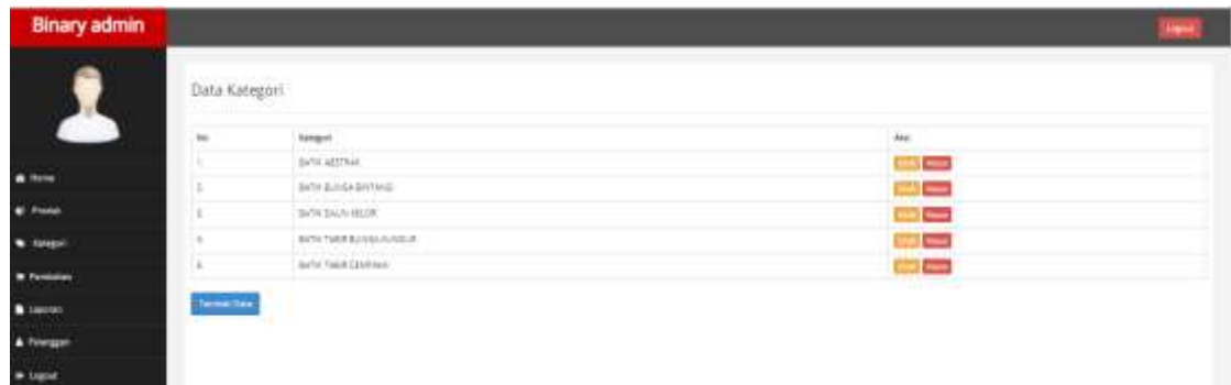
Gambar 11. Halaman kategori