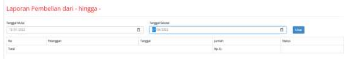
Gambar 13. Menu Input tanggal laporan