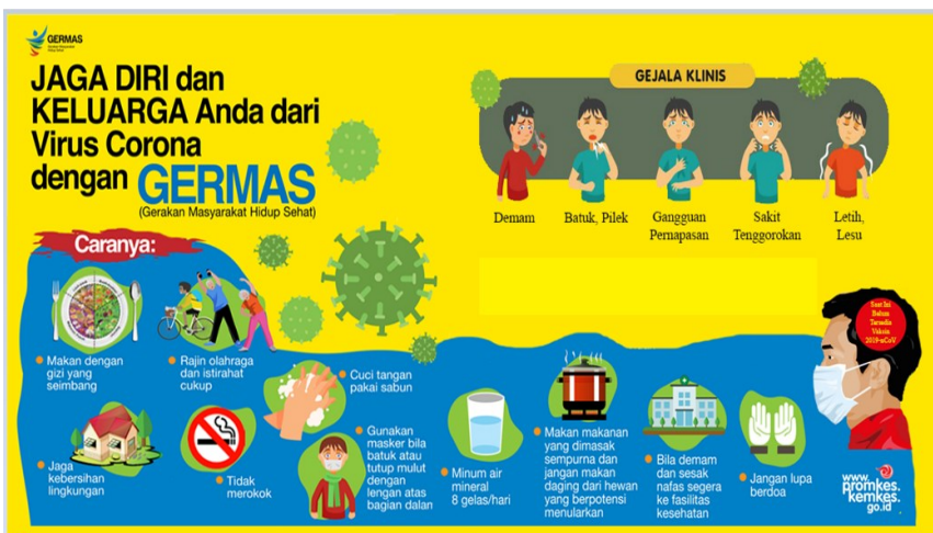
Gambar 26.2 Cegah virus corona, jaga kesehatan dengan GERMAS ( https://promkes.kemkes.go.id/cegah-virus-corona-jaga-kesehatan-dengan-germas )

Di Indonesia pencegahan terhadap wabah COVID-19 ini dibantu oleh Ikatan Ahli Kesehatan Masyarakat Indonesia (IAKMI) untuk promosi pencegahan penularannya dengan cara menjaga kebersihan lingkungan dan kebersihan diri dengan berbagai macam metode promosi kesehatan dan himbauan untuk tidak melakukan mobilisasi agar virus tidak semakin tersebar luas antar keluarga dan daerah. Berikut contoh himbauan pencegahan penularan COVID-19.