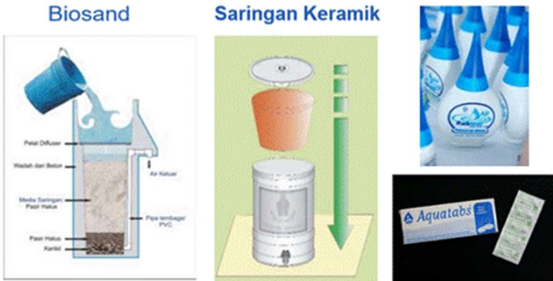
Gambar 26.3 Ilustrasi contoh pengolahan air minum sederhana skala rumah tangga (STBM Pilar 3)

Hal-hal yang perlu diperhatikan dalam pengelolaan air minum rumah tangga adalah mengolah air yang akan diminum, menjaga kebersihan wadah penyimpanan air minum, dan mencuci tangan dengan sabun sebelum mengolah dan menyajikan air minum.