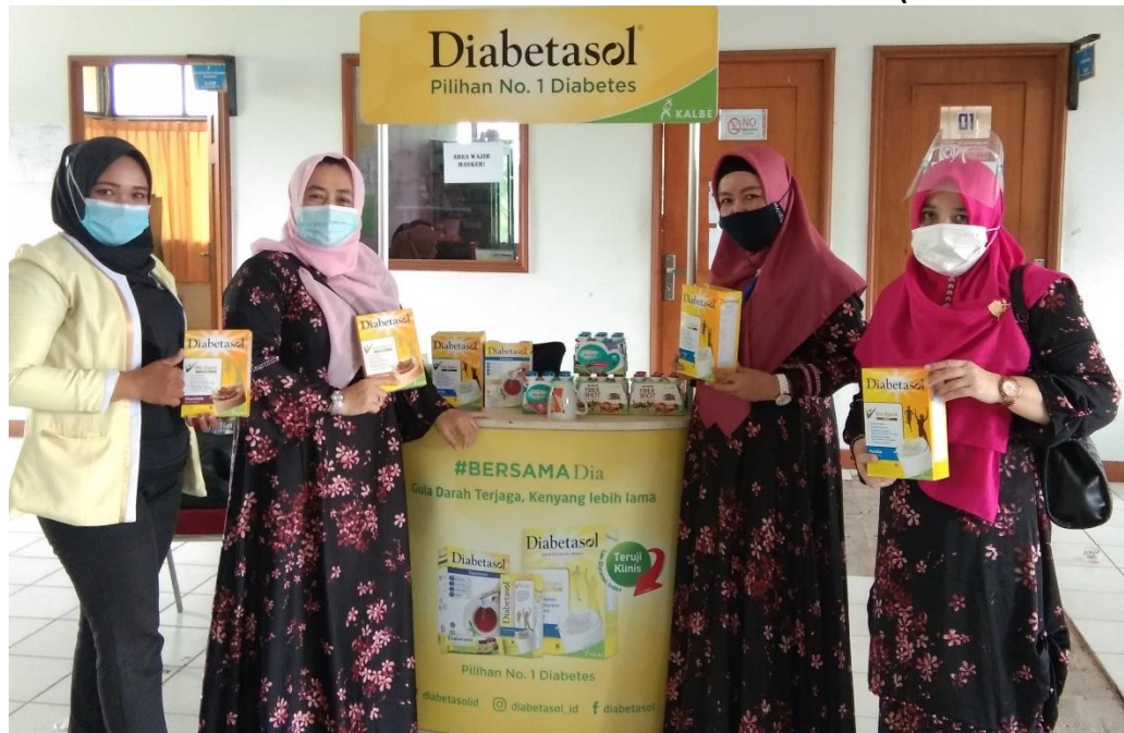
FOTO 7. BERSAMA SPONSOR ACARA PENGABDIAN DOSEN MAGISTER IKM