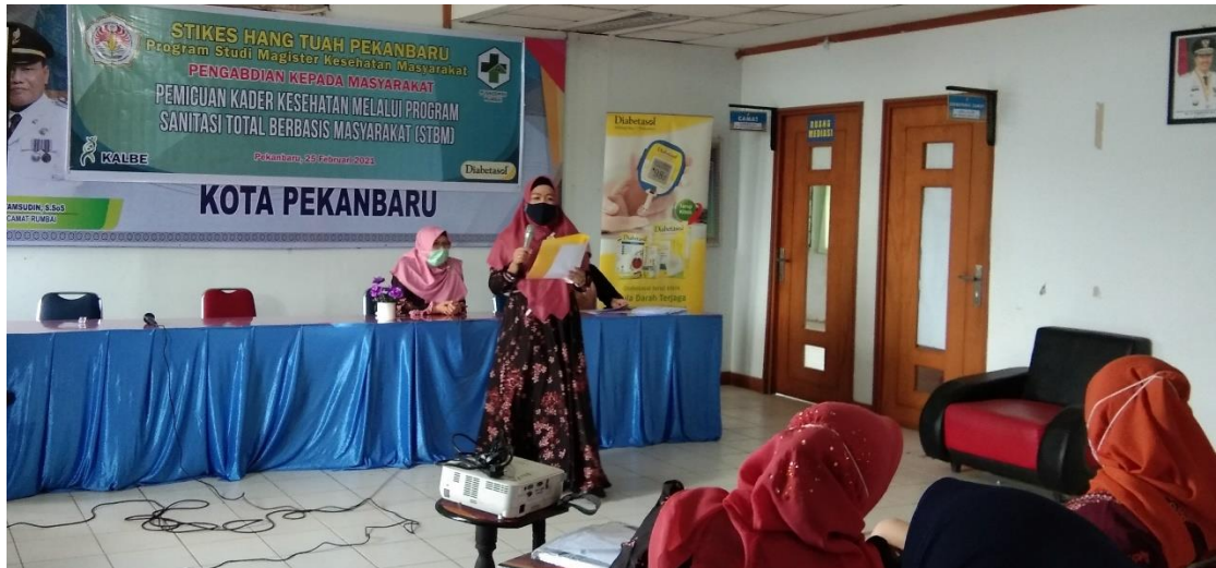
FOTO 2. PEMBACAAN HASIL DISKUSI KELOMPOK KADER STBM – C (PILAR 3-5)