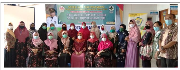
Gambar 1 : Foto Bersama Dosen Magister STIKes Hang Tuah Pekanbaru Pembicara Pengabdian Masyarakat dengan Kader STBM - Puskesmas Rumbai Pesisir – Kota Pekanbaru.

Kegiatan yang dilaksanakan dalam masa Pandemi Covid 19 ini menerapkan Protokol Kesehatan 3M: memakai masker, mencuci tangan pakai sabun yang disediakan di depan kantor kecamatan dan juga menjaga jarak selama acara berlangsung.