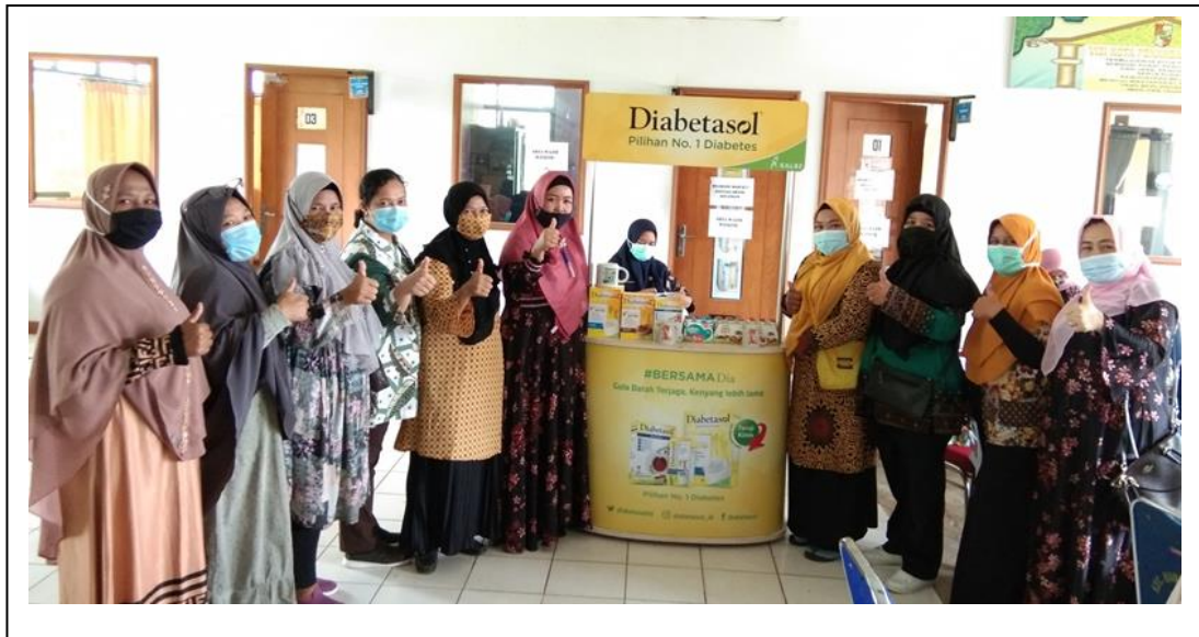
Gambar 5 : Foto bersama Dosen Pengabdian Masyarakat Prodi IKM- STIKes Hang Tuah dengan peserta dan dan Sponsor acara pengabdian masyarakat yang memberikan hadiah kepada peserta dan pembicara.