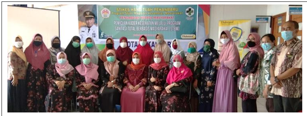
Gambar 1 : Foto Bersama Dosen Magister STIKes Hang Tuah Pekanbaru Pembicara Pengabdian Masyarakat dengan Kader STBM - Puskesmas Rumbai Pesisir – Kota Pekanbaru.

Kegiatan yang dilaksanakan dalam masa Pandemi Covid 19 ini menerapkan Protokol Kesehatan 3M: memakai masker, mencuci tangan pakai sabun yang disediakan di depan kantor kecamatan dan juga menjaga jarak selama acara berlangsung.