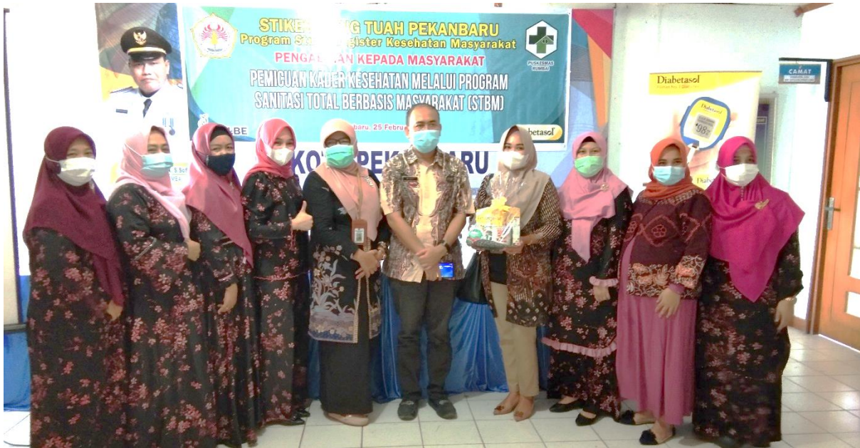
FOTO 5. BERSAMA SEKCAM RUMBAI PESISIR DAN TIM DOSEN MAGISTER IKM