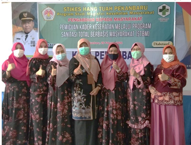
FOTO 4. BERSAMA KAPUS RUMBAI PESISIR DAN TIM DOSEN MAGISTER IKM