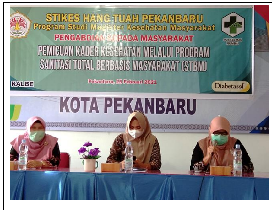
Gambar 2 : Sambutan dari Sekretaris Camat Rumbai dan Kepala Puskesmas Puskesmas Rumbai serta Kaprodi Magister Ilmu Kesehatan Masyarakat STIKes Hang Tuah.

mewakili dari Camat yang sedang menghadiri acara lainnya. Menyampaikan pesan bahwa acara pengabdian dari akademisi Dosen STIKes Hang Tuah ini sangat mengembirakan mereka karena adanya dukungan untuk membantu program pemerintah dalam masa Pandemi Covid-19 ini, STBM (Sanitasi Total Berbasis Masyarakat) merupakan salah satu program pemerintah dalam bidang kesehatan lingkungan yang sangat di perlukan pelaksanaannya oleh masyarakat dalam masa pandemi ini.