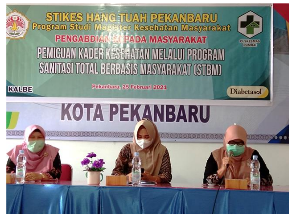
Gambar 2 : Sambutan dari Sekretaris Camat Rumbai dan Kepala Puskesmas Puskesmas Rumbai serta Kaprodi Magister Ilmu Kesehatan Masyarakat STIKes Hang Tuah.

dari akademisi Dosen STIKes Hang Tuah ini sangat mengembirakan mereka karena adanya dukungan untuk membantu program pemerintah dalam masa Pandemi Covid-19 ini, STBM (Sanitasi Total Berbaasi Masyarakat) merupakan salah satu program pemerintah dalam bidang kesehatan lingkungan yang sangat di perlukan pelaksanaannya oleh masyarakat dalam masa pandemi ini.