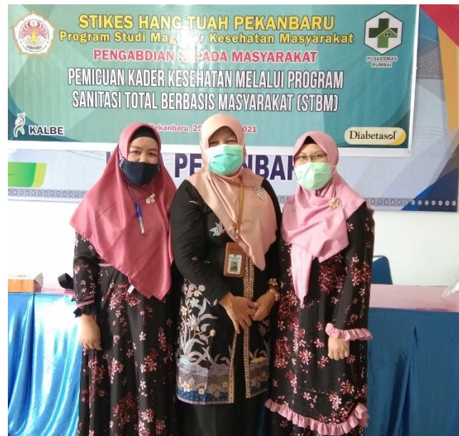
FOTO 3. BERSAMA KAPUS RUMBAI PESISIR DAN KAPRODI MAGISTER IKM