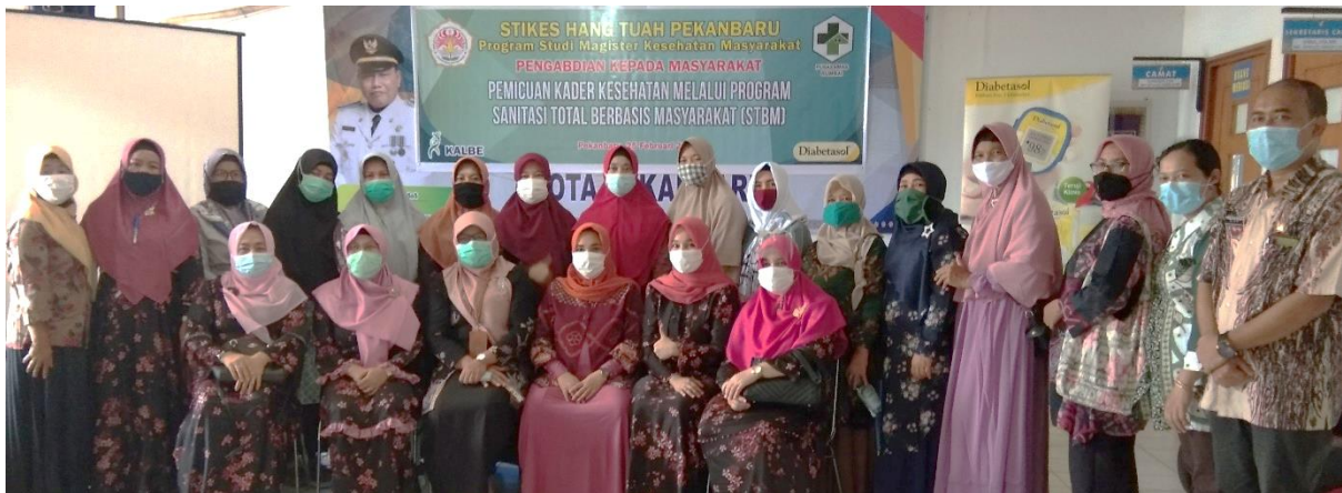
FOTO 6. BERSAMA KADER STBM DAN PUSKESMAS RUMBAI PESISIR (YANG MEWAKILI)