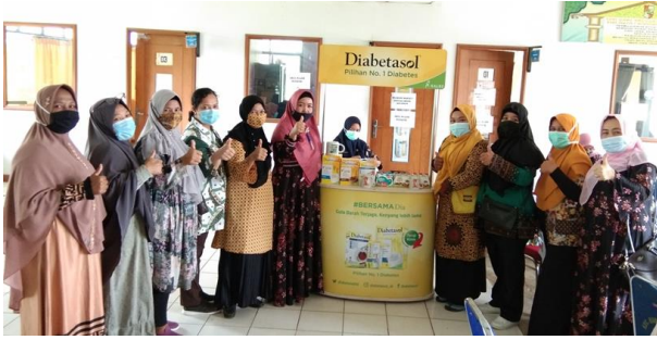
Gambar 5 : Foto bersama Dosen Pengabdian Masyarakat Prodi IKM- STIKes Hang Tuah dengan peserta dan dan Sponsor acara pengabdian masyarakat yang memberikan hadiah kepada peserta dan pembicara.

Sertifikat kepesertaan sudah mengikuti sosialisasi dan juga paket makan siang.