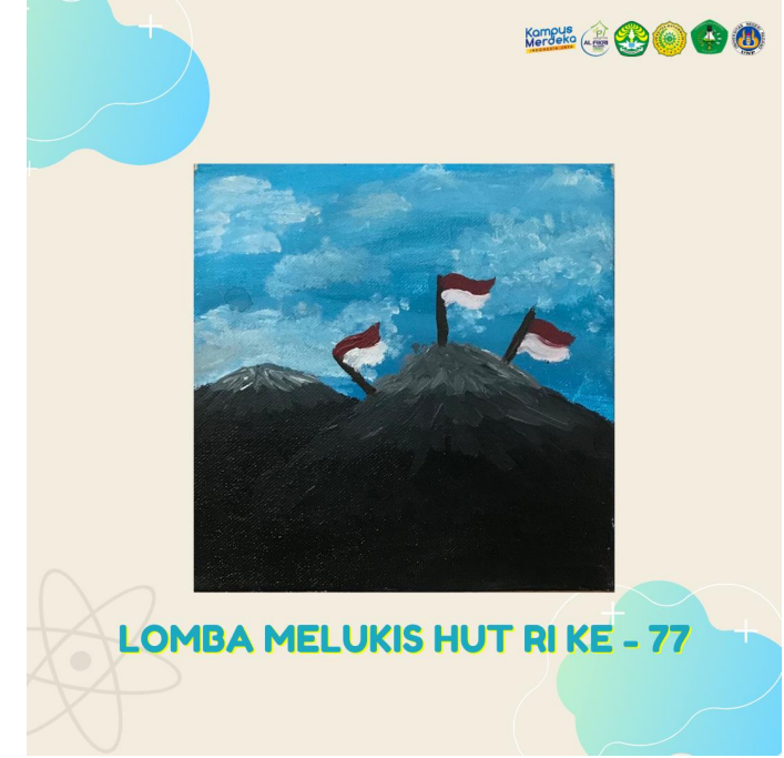
Lukisan Siswa dengan Tema “Kemerdekaan”