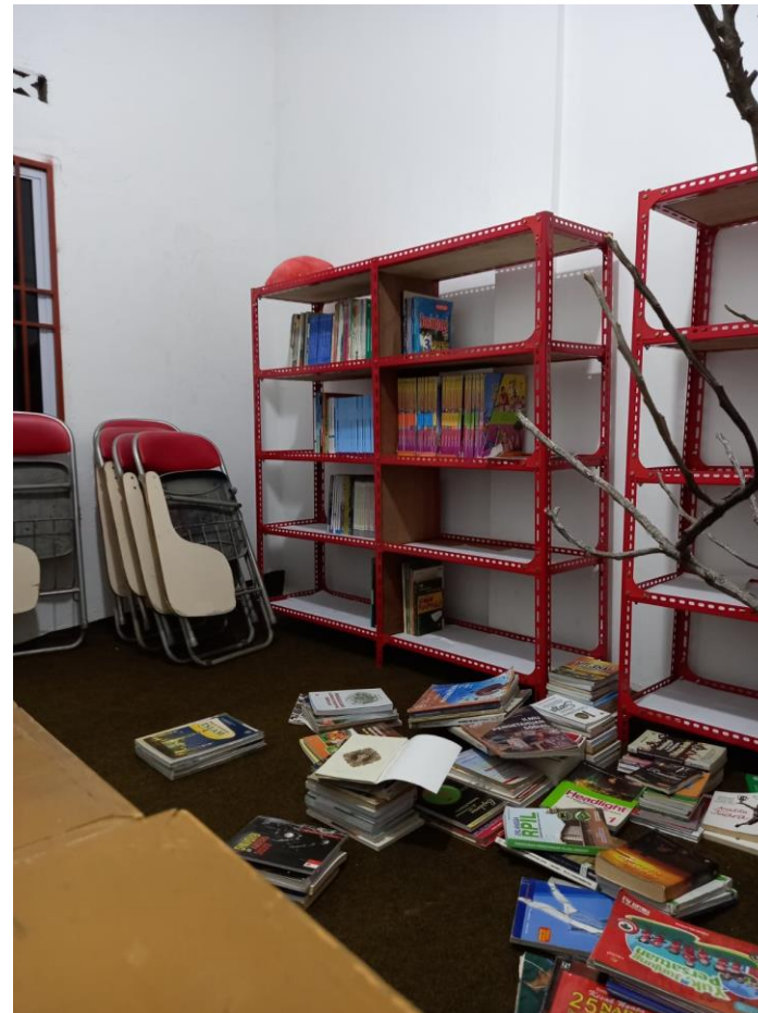
*Foto ini diambil dari SMP IT Al Fikri Islamic Green School, Pekanbaru, Riau