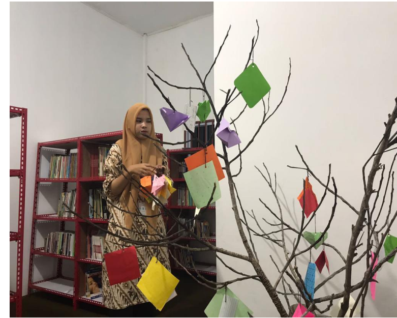
Proses Penggantungan Kertas Ilmu yang Telah dibuat oleh Siswa