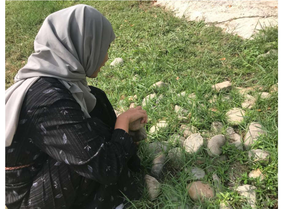
Proses Pencarian & Pengambilan Ranting dan Batu.