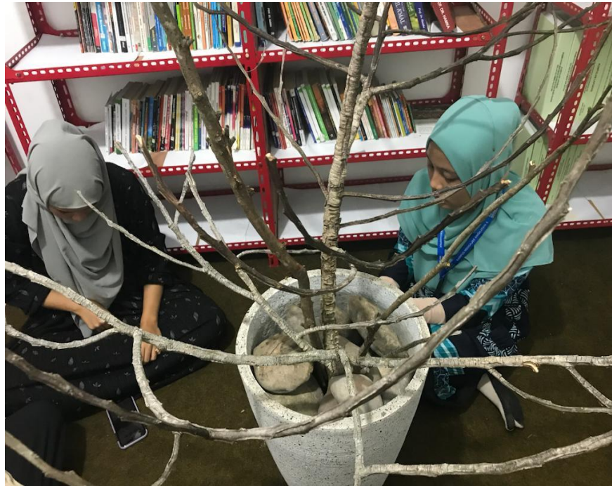
Proses Penempatan Pohon Ilmu