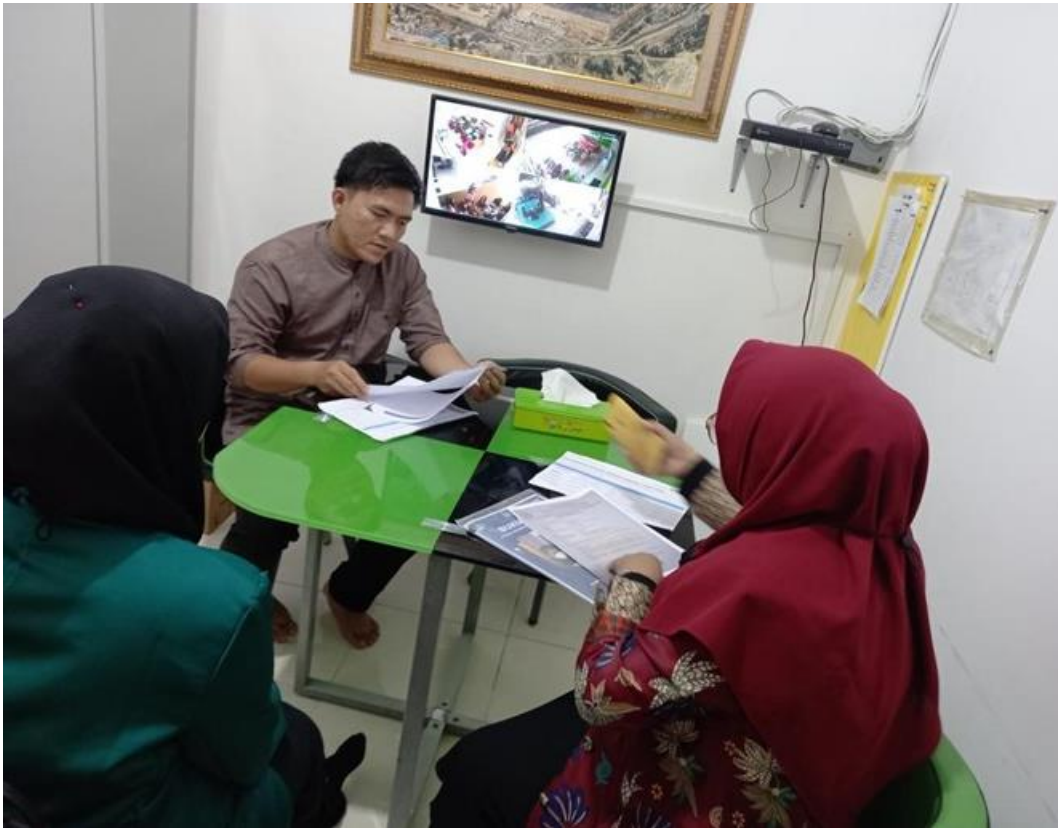
*Foto ini diambil dari SMP IT Al Fikri Islamic Green School, Pekanbaru, Riau