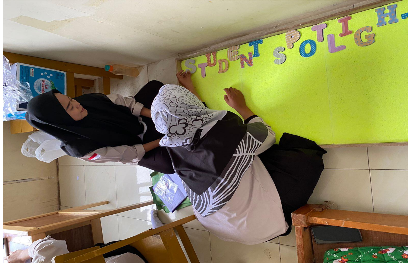
Proses Pembuatan Mading