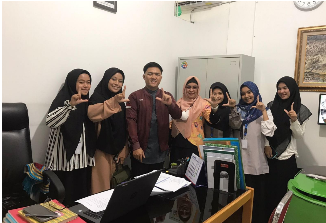
*Foto ini diambil dari SMP IT Al Fikri Islamic Green School, Pekanbaru, Riau