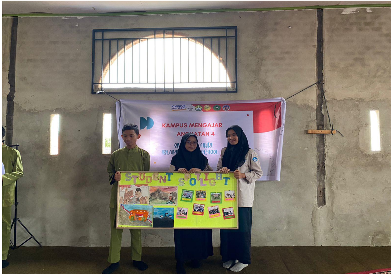
Penyerahan Program kerja Mading Kepada ketua OSA/OSIS