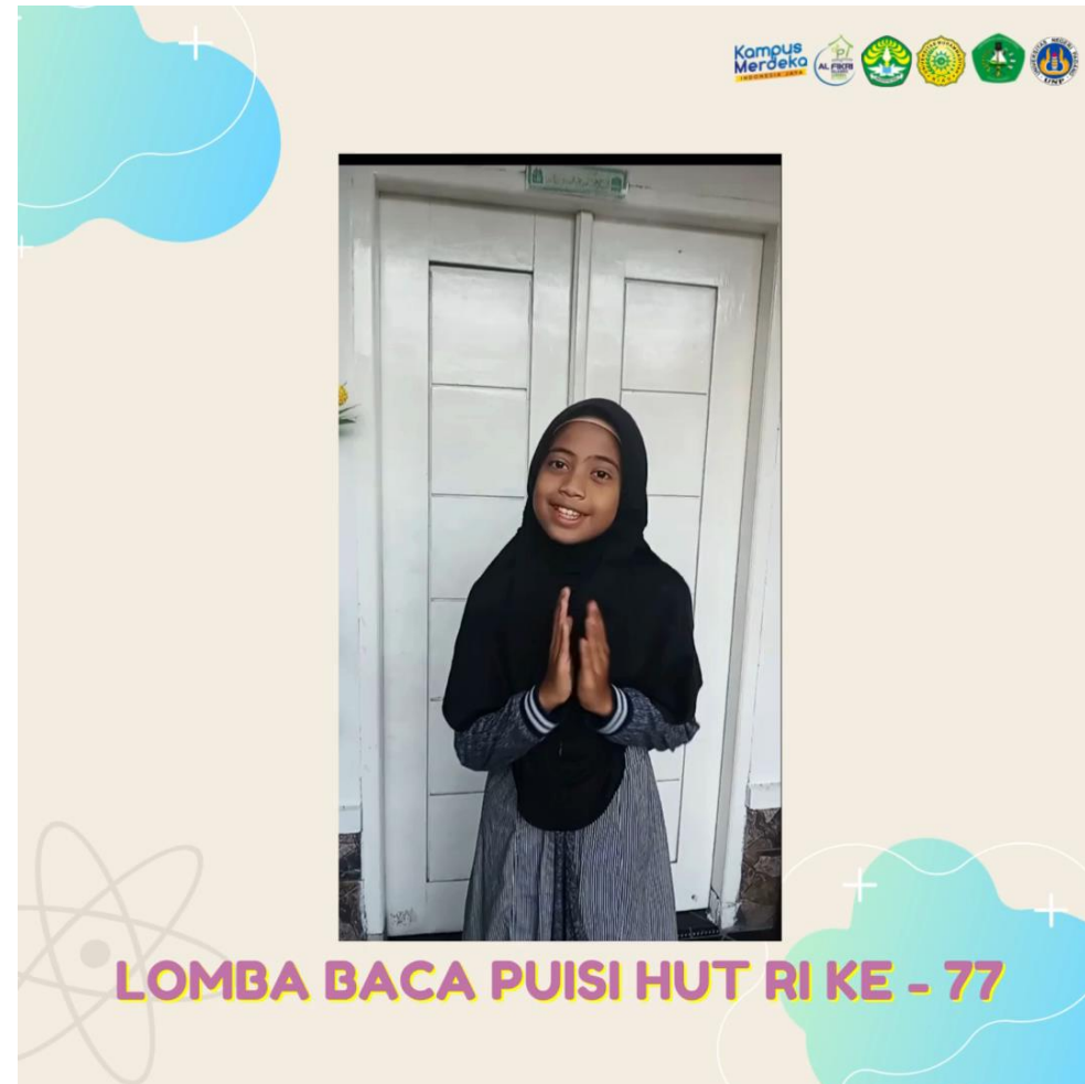
Salah satu Video Lomba Baca Puisi