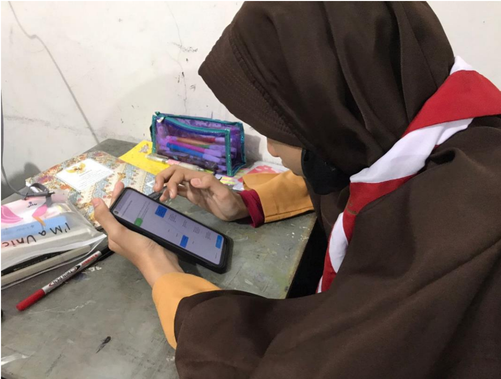
*Foto ini diambil dari SMP IT Al Fikri Islamic Green School, Pekanbaru, Riau

Program adaptasi teknologi yang dilakukan adalah membantu pelaksanaan AKM Kelas. AKM kelas (Asesmen Kompetensi Minimum) kelas merupakan suatu kegiatan yang dirancang oleh Kementerian Pendidikan dan Kebudayaan (Kemendikbud).