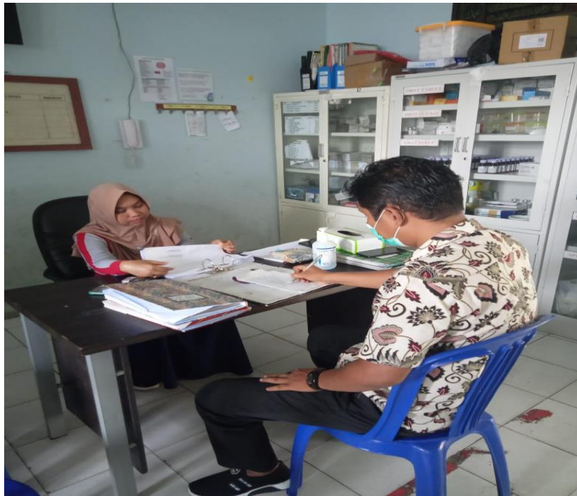
Gambar 4, Tim Pengabdian Menjumpai Pihak Puskesmas sekaligus Ketua kader Posyandu

Bentuk kegiatan pengabdian yang dilaksanakan adalah penyuluhan dan pendidikan kesehatan pada kader posyandu, tentang bagaimana cara penerapan protocol kesehatan dalam upaya mencegah penularan Covid 19.