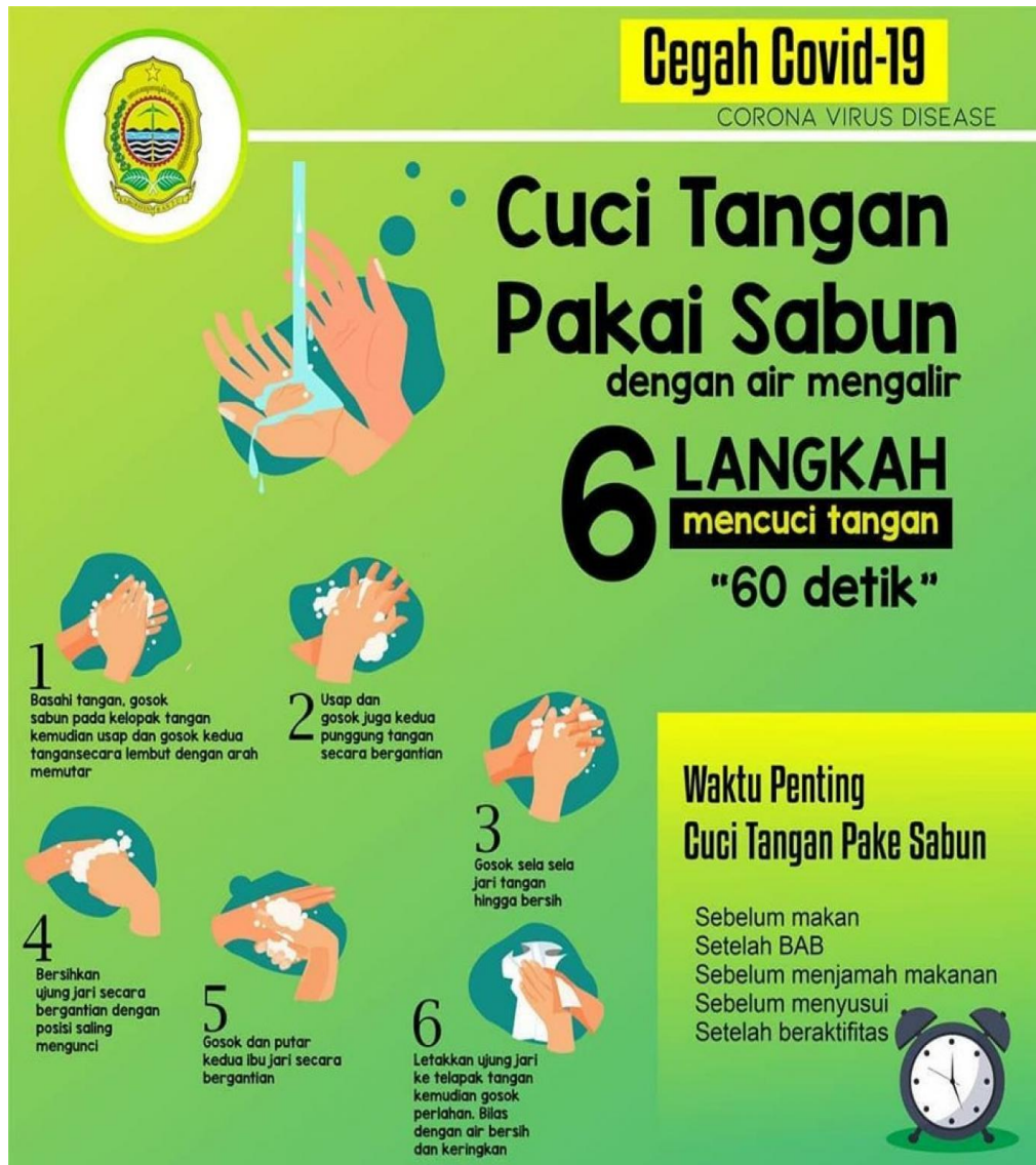
Gambar 2. Panduan Mencuci Tangan dengan Air dan Sabun

Membasahi tangan dengan air, 2. Menggunakan sabun, 3. Mengusap kedua telapak tangan bagian dalam, 4. Tangan kanan mengusap punggung dan sela jari tangan kiri, 5. Tangan kiri mengusap punggung dan sela jari kanan, 6. Mengusap sela jari dengan telapak tangan berhadapan, 7. Membersihkan punggung jari kedua tangan dengan telapak saling mengunci, 8. Membersihkan ibu jari kedua tangan, 9. Memutar ujung jari pada telapak tangan, 10. Bilas hingga bersih dan keringkan.