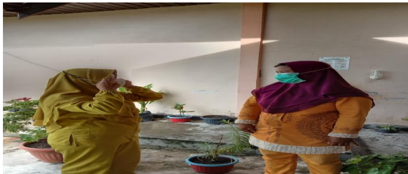
Gambar 5, Proses penerapan pemakaian masker yang baik benar