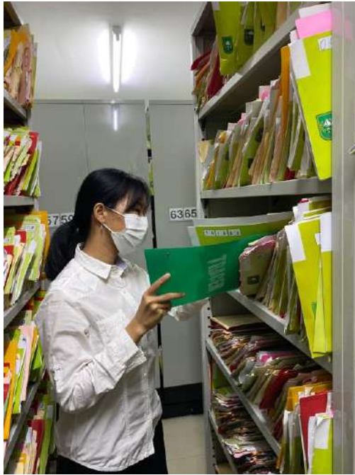
PKM di Bagian Filling