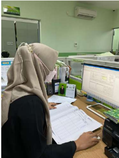
PKM di Bagian Coding