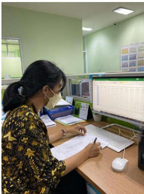
PKM di Bagian Analisa Rekam Medis