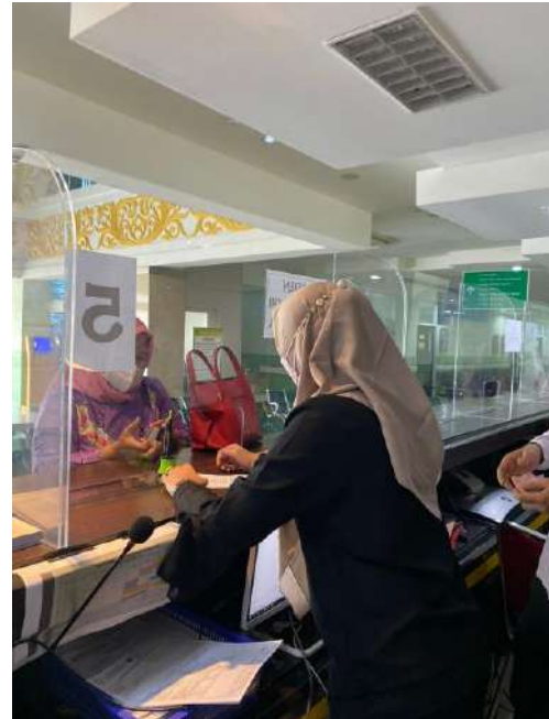
PKM di TPPRJ