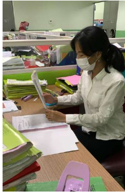
PKM di Bagian Assembling