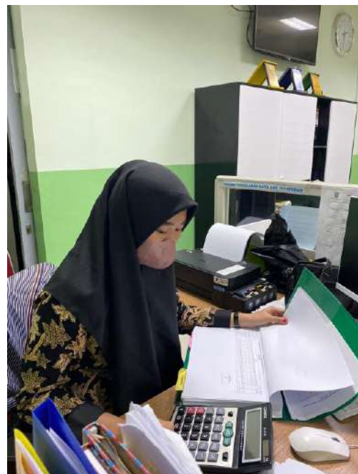
PKM di Bagian Pelaporan