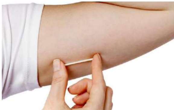
1.3 GAMBAR IMPLAN