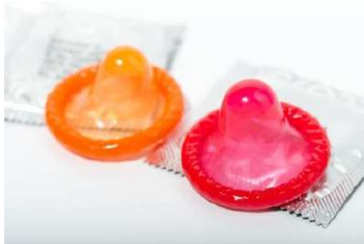
1.5 GAMBAR KONDOM