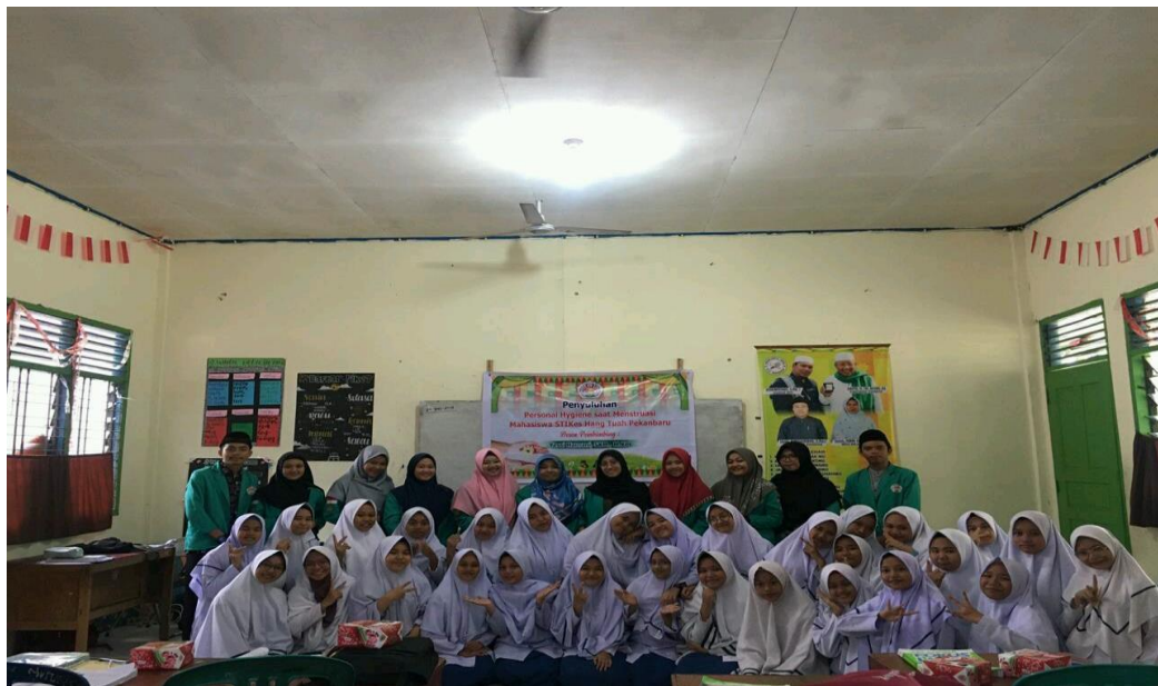
FOTO BERSAMA RESPONDEN