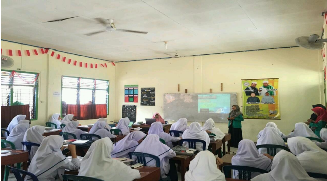
PROSES PEMBERIAN MATERI MENGENAI PERSONAL HYGIENE SAAT MENSTRUASI